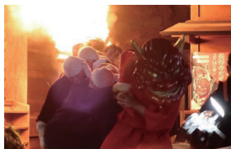
(長谷寺の「だだおし」)